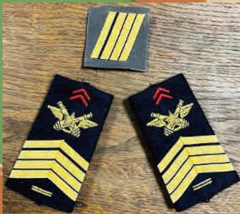
Nouveau galon à quatre chevrons pour les « sergents-chefs BM2 ».