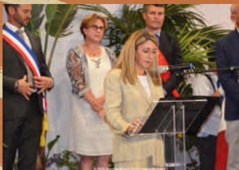
Madame Patricia MIRALLÉS, secrétaire d'état aux Anciens Combattants et au Devoir de Mémoire